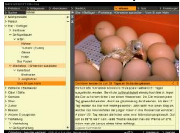
Wissen-Modul: Diashow im Workshop «Hühnereier ausbrüten»

Die Kinder tragen ihre Entdeckungen im Unterstufen-Tagebuch, u.a. mit stufengerechten Zeichnungsaufträgen zusammen. Zum gewählten Thema «Das Huhn» erteilt die Lehrkraft den Auftrag, die auf der CD gefundenen Informationen auf dem ausdrucksbaren Arbeitsblatt festzuhalten. In einem Workshop auf der CD wird das Ausbrüten von Hühnereiern mit einem sog. «Motorbrüter» im Schulzimmer beschrieben: Die Klasse führt diesen Auftrag gemäss den erhaltenen Anweisungen durch. Je nach Ziel lassen sich damit eine Vielzahl von Schreibanlässen und Beobachtungsaufträgen formulieren.