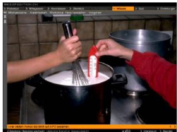
Wissen-Modul: Diashow im Workshop «Käse selbst herstellen»

Das Projekt wird mit dem Weitergeben des Gelernten abgeschlossen: Jede Gruppe verfasst zu ihrem Thema einen illustrierten Text auf dem Computer für die gemeinsame «Milchzeitung» oder eine Milch-Ausstellung (für andere Schulklassen, die Eltern...). Alternativ kann eine Diashow oder ein sog. «Hypertext» erstellt werden. Die Bilder und Töne auf der Materialien-CD werden für diese Arbeiten eingesetzt. (s. Lehrerkommentar im edupack).