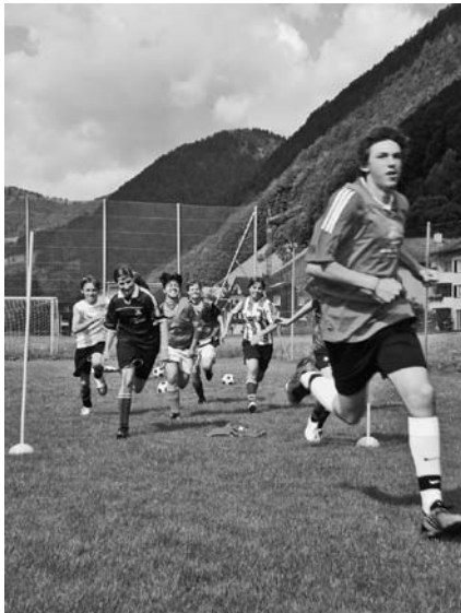
Fussballtraining im Jugendsportlager in Alt St.Johann.

Bereits zum achten Mal verbringen jeweils rund 40 Jugendliche in der ersten Sommerferienwoche des Kantons St.Gallen eine Sportwoche im Obertoggenburg. Dieses Jugendlager wird von der Abteilung Jugend+Sport (J+S) des Amtes für Sport des Kantons St. Gallen organisiert. Unter kundiger Anleitung von J+S-Leiterinnen und -Leitern werden die Teilnehmenden in verschiedenen Sportarten ausgebildet.