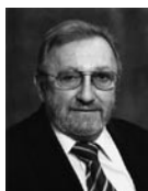
Jörg Schett www.schett.ch